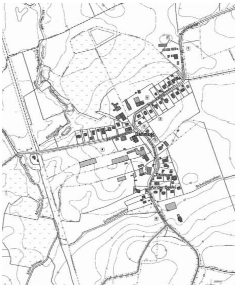
Alternativenprüfung der Gemeinde Dahmker